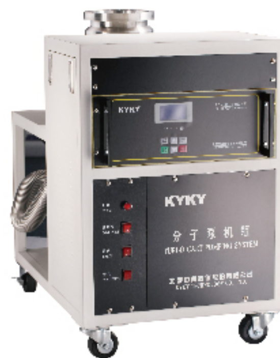
北京中科科仪股份有限公司 KYKY TECHNOLOGY CO., LTD.